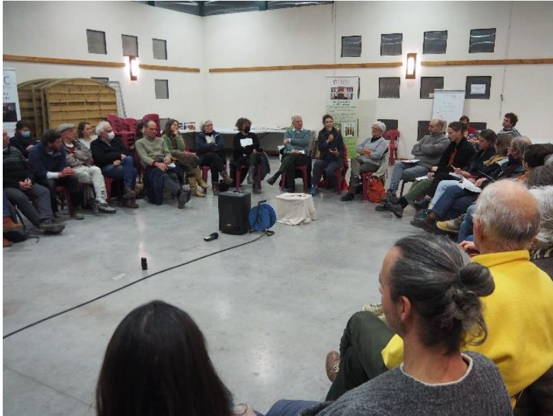
Photo prise lors de l'Université éphémère de la Haute Vallée de l'Aude